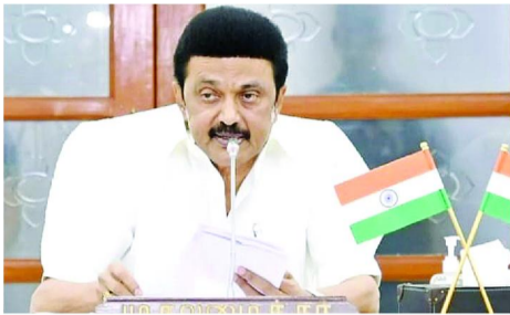
వారిని మానవత్వంతో ఆదరించి, ఆదరించాలని మీ అందరినీ కోరుతున్నాను.

విల్లివాకం న్యూస్: ప్రజల్లో హెచ్ఐవి, ఎయిడ్స్ పట్ల అవగాహన కల్పించాలని ముఖ్యమంత్రి ఎం.కె.స్టాలిన్ ఒక పత్రికా ప్రకటనలో తెలిపారు. తమిళనాడు ప్రభుత్వం మరియు ప్రభుత్వేతర సంస్థలు హెచ్ఐవి నివారణ పనులను సమర్థవంతంగా అమలు చేయడం వల్ల, తమిళనాడులో హెచ్ఐవి సంక్రమణ సంభవం జాతీయ రేటు 0.23 శాతం నుండి 0.16 శాతానికి తగ్గింది. తమిళనాడులో హెచ్ఐవి/ఎయిడ్స్ రహిత రాష్ట్రాన్ని సృష్టించేందుకు కట్టుబడి ఉన్నాను, హెచ్ఐవి/ఎయిడ్స్ సోకిన వ్యక్తి మనలో ఒకడనే విషయాన్ని దృష్టిలో ఉంచుకుని,